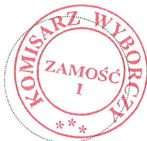
(miejsce na pieczęć Komisarza Wyborczego)

§ 5. Postanowienie wchodzi w życie z dniem podpisania i podlega ogłoszeniu w Dzienniku Urzędowym Województwa Lubelskiego oraz podaniu do publicznej wiadomości w Biuletynie Informacji Publicznej i w sposób zwyczajowo przyjęty na obszarze Miasta i Gminy Szczepieszyn.